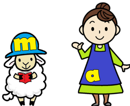
聖マリアンナ医科大学医学情報センター マスコットキャラクター 『マリーさん』と『アンナさん』